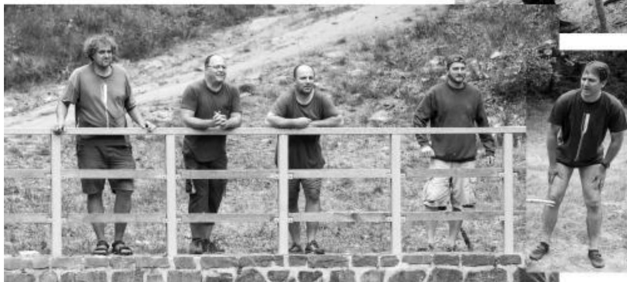
realizace: Boburn Pešek Zedon Maruš Dastén ; lana: Talovín a Céef ; foto: Snídek